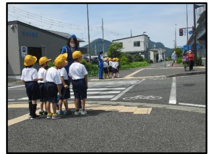
交通安全教室の様子：1年生